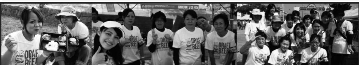
あやばに1名、はあと3名、白保1名、マリン1名、ふたば3名、Happy3名、コスモ3名、前木3名 18名の方がご協力くださいました。ありがとうございます。