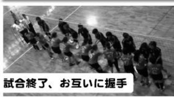
試合終了、お互いに握手