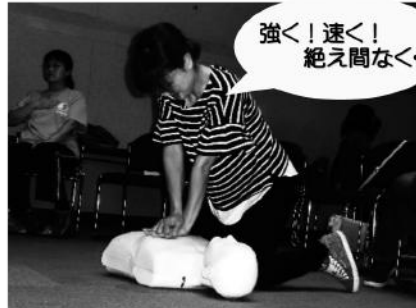
心臓マッサージ (胸骨圧迫) 強く・速く・絶え間なく、しっかり押す