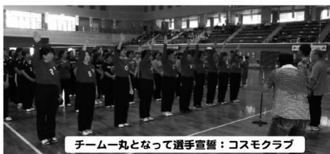
チーム一丸となって選手宣誓：コスモクラブ