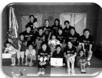
優勝 なかよしクラブ

第三十六周年 八重山ママさんバレーボール結成記念大会 三月十九日(日) 石垣市総合体育館