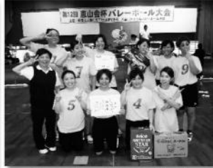
準優勝 白保クラブ