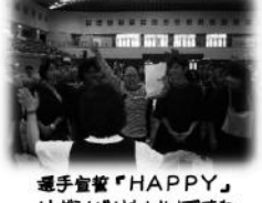
選手宣誓「HAPPY」 リボンがかわりましたね