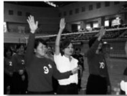
力強い選手宣誓 コスモクラブ