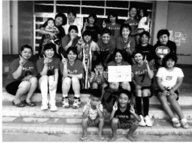
優勝 なかよしクラブA