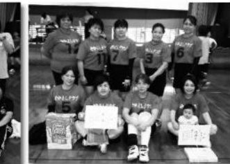
3位 なかよしクラブ