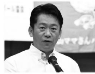
あいさつ 石垣市長 中山 義隆