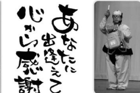
謎の司会者(ひみつ)