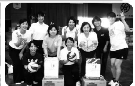
ハッスルチーム賞 ふたばクラブ ファミリー賞 オーシャンクラブ