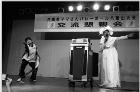
リサイタル(県余興委員会)