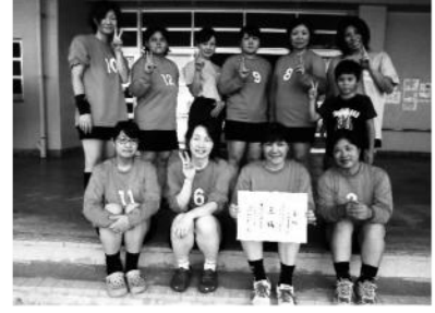
三位 コスモクラブ