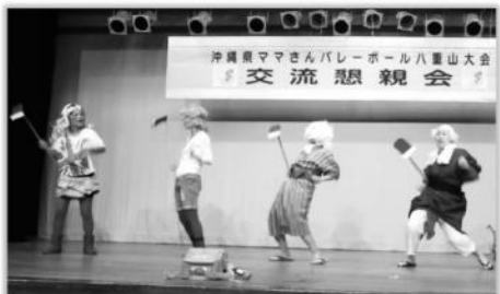
平成マミド～マ(畑人シスターズ)