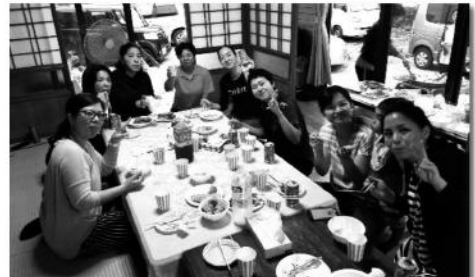
おいしゅうございます〜