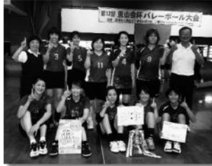
優勝 下地脳神経外科