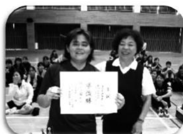
準優勝 コスモクラブ