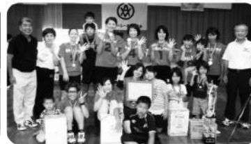
優勝 なかよしクラブA