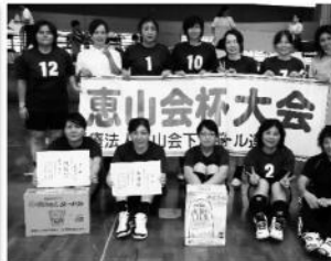
準優勝 コスモクラブ