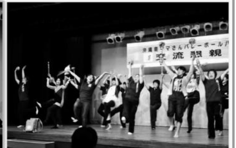
あぐがばな どうすがばな(Peace)