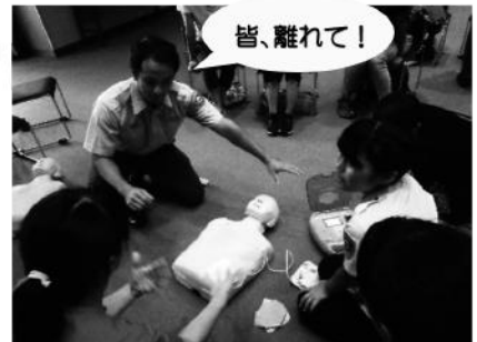
AEDは正しく使いましょう 音声案内に従ってください。