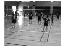
40代以上も…打ちます!! 飛びます!! 抱いまくります!!