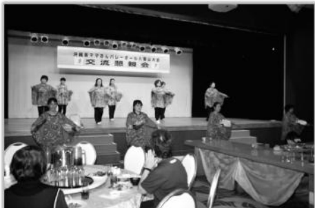
歓迎の舞(八重山連盟)