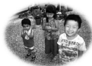
たくさん食べるぞう