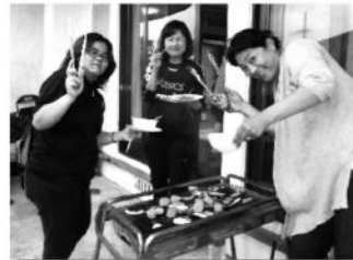
トング持つ姿がイカしてるっ