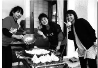
いつ焼くの?今でしょ!!