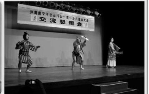
かぎやで風(でいご座)