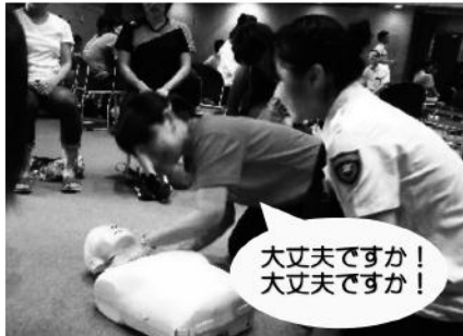
反応の確認 (声をかける)