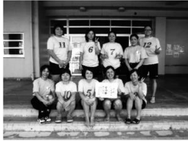
準優勝 白保クラブ