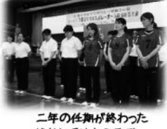
二年の任期が終わった 競技部「前木クラブ」