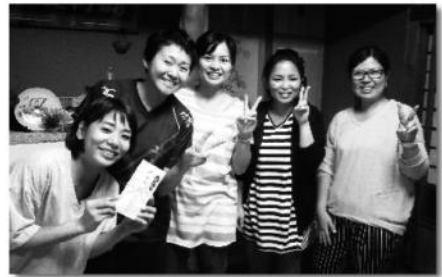
沖縄県予選会頑張ってきます