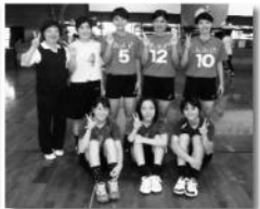
今年より一般の部には 高校生(3名)も参加OK!