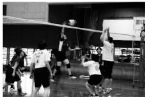
下地脳神経外科 VS 白保クラブ